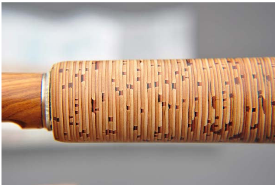
Rukojeť od Kurta Zumbrunna (CH) na skoro hotovém prutu

Konečně přicházím k vyvrcholení a zakončení setkání. Těsně před obědem v neděli jsme zahájili losování o nově vyrobený muškařský prut a mnoho jiných hodnotných cen, které byly dotovány účastníky. První cenu, repliku Hardy CC de France, 8 stop #5, vyhrál los č. 91, jehož majitel, Alex Kechagias z Bavorska, při předávání zářil, jako kdyby vyhrál 10 milionů eur.