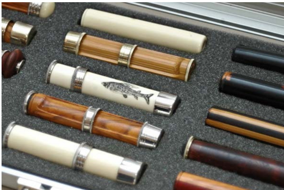
Nádherné skvosty od Waldemara Nowaka (D)

Mnoho z nich opětovně vítá možnost předložit vlastnoručně vyrobené štípané pruty širokému okruhu kolegů a přátel, promluvit si osobně se sousedem nebo si odnést nové nápady pro svoje hobby, třeba do příštího setkání. Nepřeberné množství všech možných či myslitelných provedení prutů čekalo na posouzení – Quad (čtyřboké) i Okta (osmiboké), duté i plné, ze čtyř nebo až ze třinácti štěpin, světlé nebo tmavé, se spojkami z bambusu, alpaky nebo carbonu. Remeslné provedení, povrchová úprava a celá řada zajímavých nápadů na vybavení byly k neuvěření. Samozřejmě měl každý z účastníků možnost vzít všechny tyto pruty do ruky a na louce je vyzkoušet a porovnat. Málokdy se totiž nabízí příležitost ukázat takové množství bambusových prutů tolika kritickým hlavám a pozorným očím.