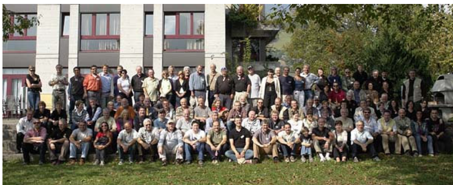
Účastníci 2. Evropského sjezdu v Sarnen 2009

Samozřejmě nesmím zapomenout touto cestou taky poděkovat všem hostům za jejich účast a našim pomocníkům a pomocnicím – manželkám – za jejich bezvýhradnou pomoc, bez níž realizace takového neprofitového setkání není myslitelná.