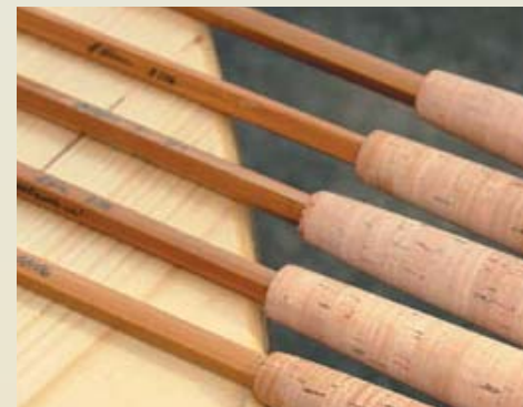
Dasselbe Taper in den unterschiedlichen Bauweisen Quad, Penta, Hex, Okta und 13-fach.

ser ein Taper gewählt, dieses für die Bauweisen Quad, Penta, Hex, Spiral, Okta und 13-fach umgerechnet und diese sechs Ruten auch gebaut, teilweise sogar mit Bambushülsen ... Bjarne Fries wollte seinen Augen nicht trauen und war total begeistert über diese einmalige Möglichkeit zu vergleichen.