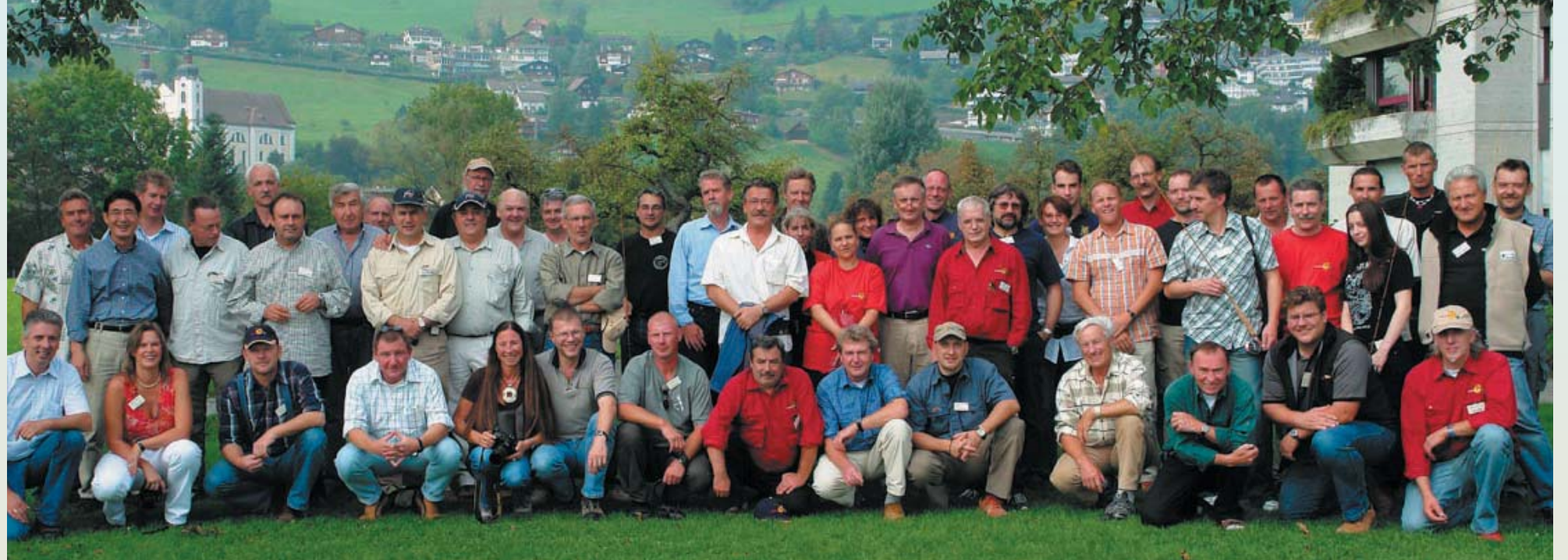
Sarnen 2006: Das große Familienfoto.